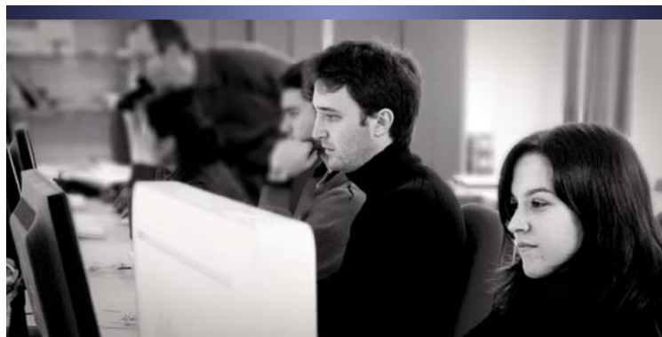
Estudiantes de diseño gráfico de la Escuela de Arte de Algeciras.

LAS ENSEÑANZAS ARTÍSTICAS SUPERIORES DE DISEÑO GRÁFICO SE CREAN CON EL OBJETIVO DE ATENDER LAS NUEVAS DEMANDAS LABORALES Y LAS NECESIDADES DE CUALIFICACIÓN PROFESIONAL DE LA SOCIEDAD CONTEMPORÁNEA ANDALUZA. ESTOS ESTUDIOS SE ENCUENTRAN EN EL MARCO DE LA EDUCACIÓN SUPERIOR EUROPEA Y OFRECEN A LOS ESTUDIANTES DE DISEÑO GRÁFICO UNA TITULACIÓN EQUIVALENTE, A TODOS LOS EFECTOS, A LA DE GRADO.