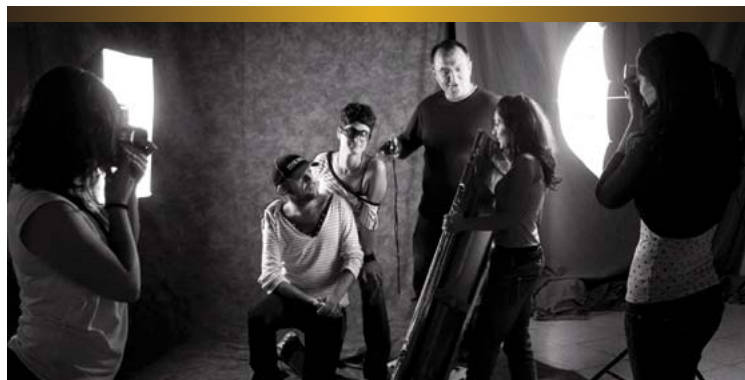
Clase práctica de fotografía con modelos utilizando iluminación de estudio.

LOS PROFESIONALES DE LA FOTOGRAFÍA REALIZAN SU TRABAJO EN LOS ÁMBITOS DE LA PUBLICIDAD, EL DISEÑO, LA MODA, EL REPORTAJE SOCIAL, LA INDUSTRIA, LA CIENCIA, EL MUNDO EDITORIAL, EL FOTOPERIODISMO O A LA OBRA ARTÍSTICA PERSONAL.