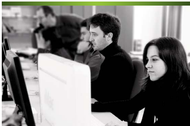
Alumnos y alumnas de Gráfica Publicitaria trabajando en el aula.

EL CICLO FORMATIVO DE GRÁFICA PUBLICITARIA ESTÁ ORIENTADO A LA FORMACIÓN DE PROFESIONALES DEL DISEÑO GRÁFICO Y PUBLICITARIO.